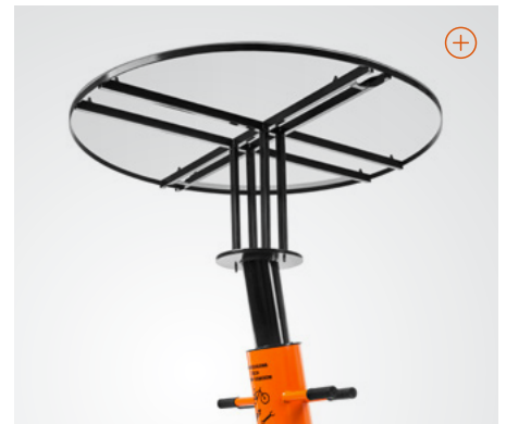
Dachelement sorgt für Schutz gegen Regen und Hagel.