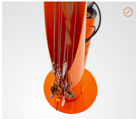
Werkzeug ist mittels Drahtseil befestigt.