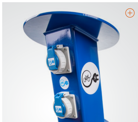
Lademöglichkeiten für E-Bikes.