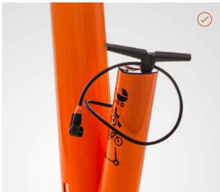
Luftpumpe mit Adapter für die üblichen Ventile.